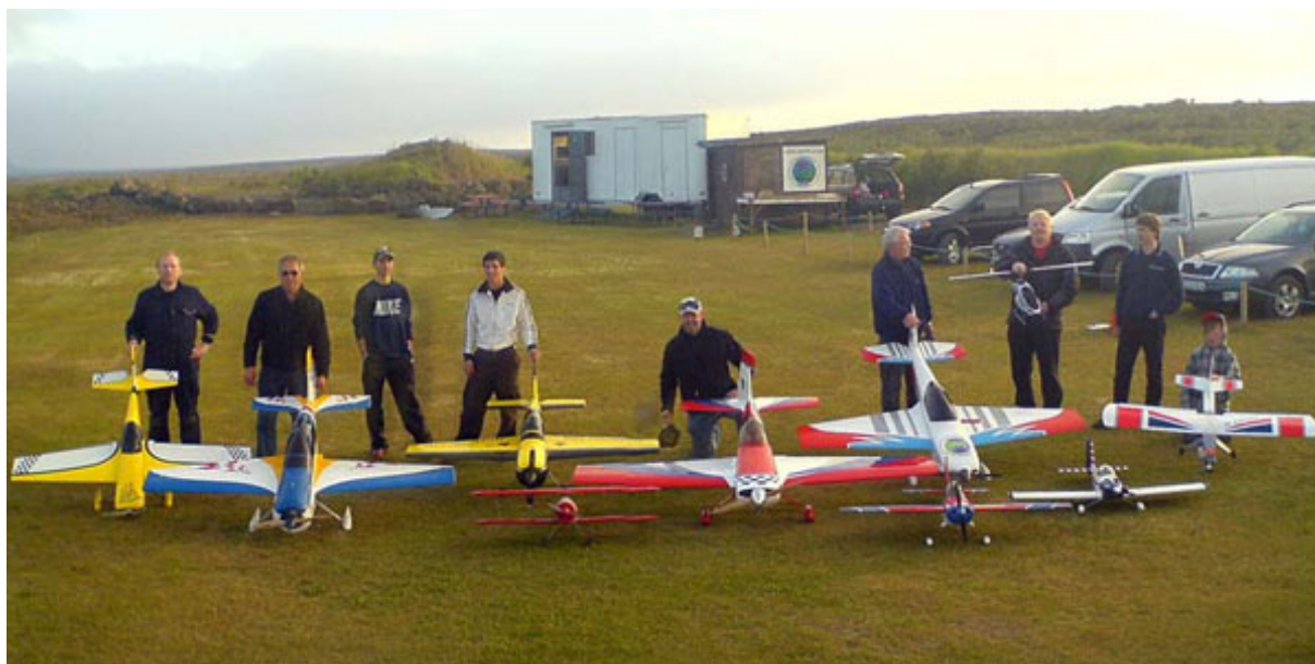
Félagsmenn voru duglegir að fjölmenna á Arnarvöll. Módel af öllum stærðum og gerðum.

Mínum á myndasafn félagsins, http://modelflug.net/myndir/