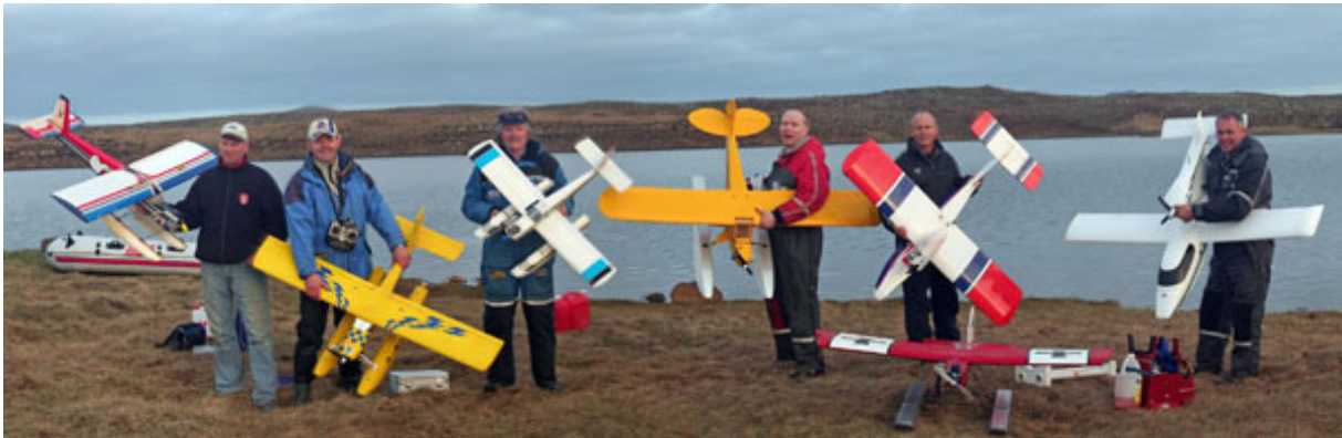
Flotflugkoma FMS 2008.