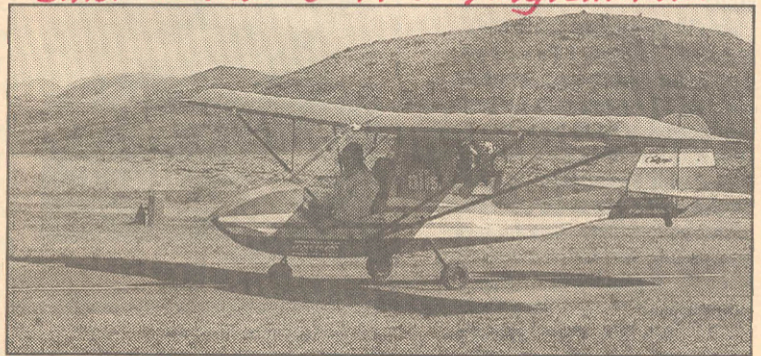
Ómar Ragnarsson gerir sig kláran í flugferð á Fisinu. 1991.